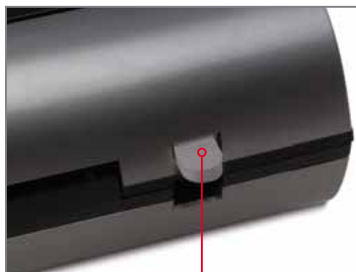
'Jam Release' Button