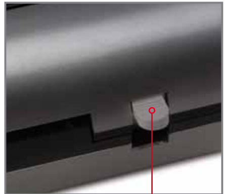
'Jam Release' Button