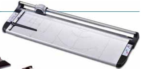
Elite Series A4, A3, A2, A1