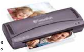
Compact Series A4, A3