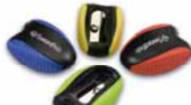
Soft Grip & Twin Soft Grip