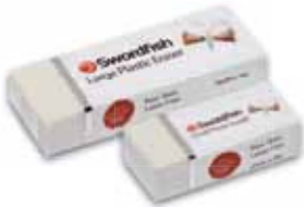
Large/Small Plastic Eraser