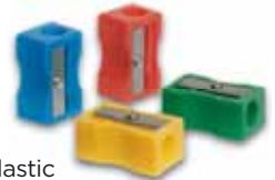
Plastic & Metal Wedge