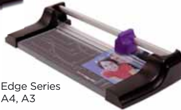
Edge Series A4, A3