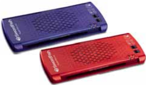
SuperSlim Series A4