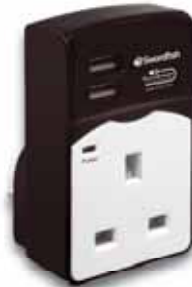
VariPlug Dual USB Auto-Detect Charger