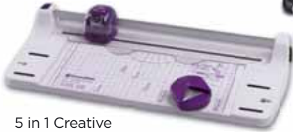
5 in 1 Creative A4