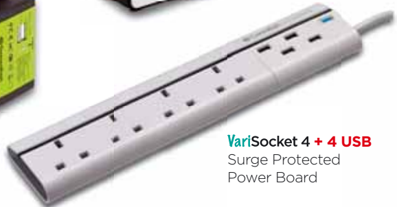
VariSocket 4 + 4 USB Surge Protected Power Board