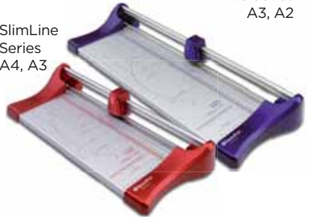
SlimLine Series A4, A3