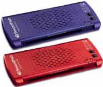
SuperSlim Series A4