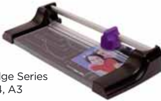
Edge Series A4, A3