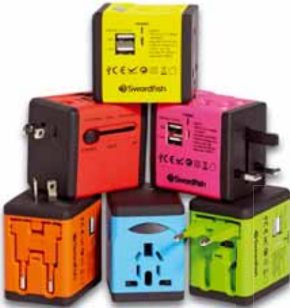
VariPlug Dual USB Universal Travel Adapter