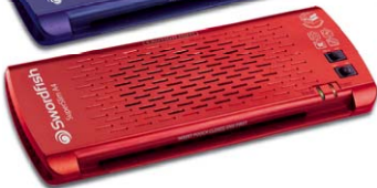
SuperSlim Series A4