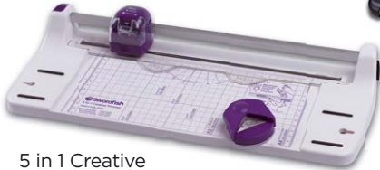
5 in 1 Creative A4