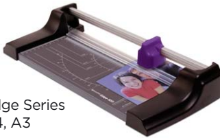
Edge Series A4, A3