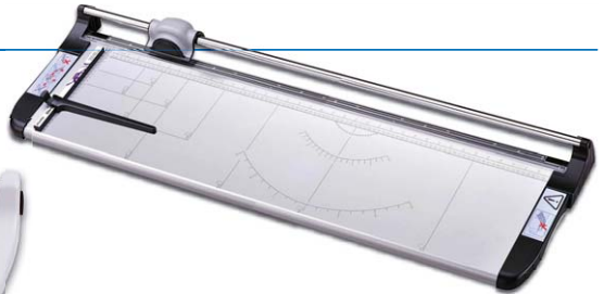
Elite Series A3, A2