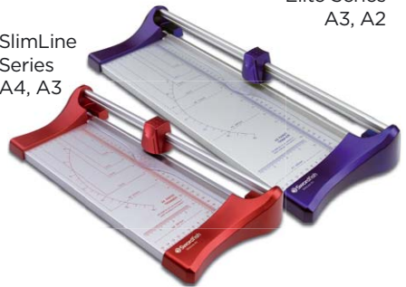
SlimLine Series A4, A3