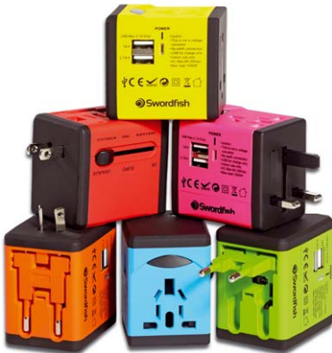
VariPlug Dual USB Universal Travel Adapter