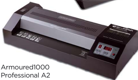
Armoured1000 Professional A2

To find out more information on the full range of products, visit us at www.snopakebrands.com