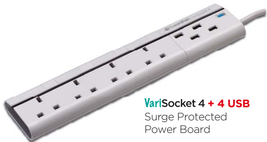
VariSocket 4 + 4 USB Surge Protected Power Board