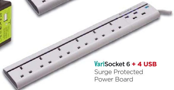
VariSocket 6 + 4 USB Surge Protected Power Board