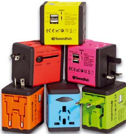
VariPlug Dual USB Universal Travel Adapter