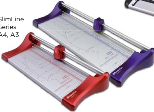
SlimLine Series A4, A3