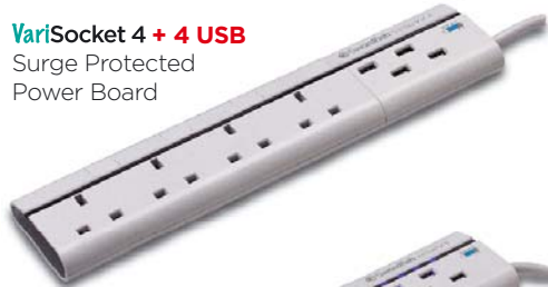
VariSocket 4 + 4 USB Surge Protected Power Board