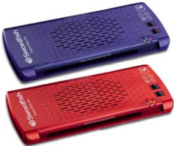
SuperSlim Series A4